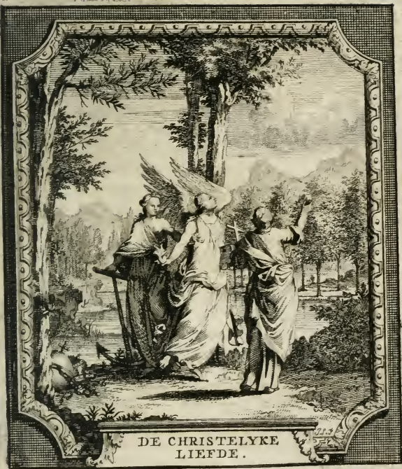
DE CHRISTELYKE LIEFDE.